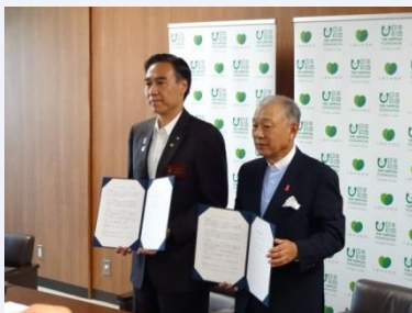
写真（左）：日本財団笹川会長と阿部知事による協定締結

協定当日に実施した、県内市町村長等を対象とした『長野県「いのち支える地域自殺対策」トップセミナー』の開催を皮切りに、県自殺対策計画の策定、対策推進のための啓発活動や子ども・若者向けのリーフレットの作成、県内各地での総合相談会の開催、民間団体を対象とした自殺対策に関する研修会の実施等、幅広い分野の取組を進めています。