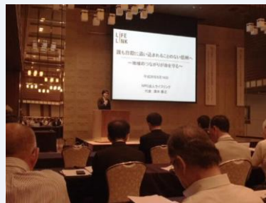
写真（右）：『長野県「いのち支える地域自殺対策」トップセミナー』の様子