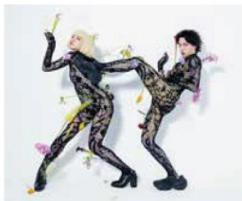
アオイツキ（日本） 作品イメージ