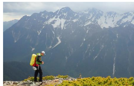
生息数調査 (北アルプス)