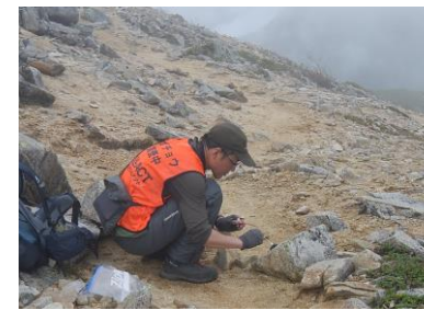
小型哺乳類のライチョウへの影響調査 フンの採取 (北アルプス)