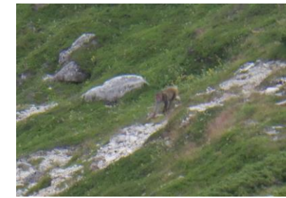
生息域に踏み込んでいるサル (中央アルプス)