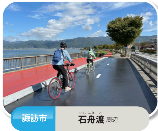
諏訪市 いしふなと 石舟渡 周辺