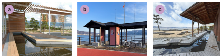
a 諏訪湖ハイツ(岡谷市) b AQUA未来(下諏訪町) c 諏訪市湖畔公園(諏訪市)

諏訪湖畔には無料で利用できる足湯があります。サイクリング中の休憩スポットとして、諏訪湖の景色を楽しみながらおくつろぎください。