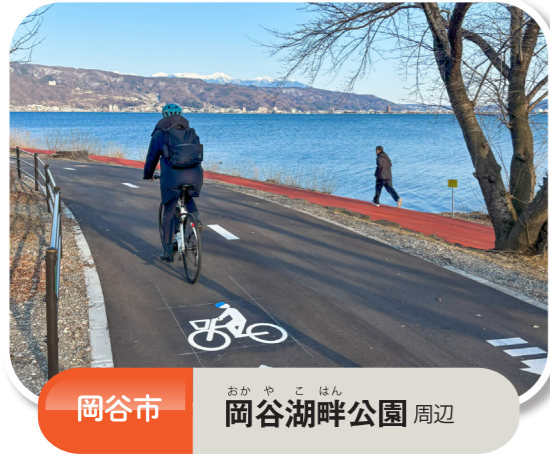
岡谷市 あかやこはん 岡谷湖畔公園 周辺