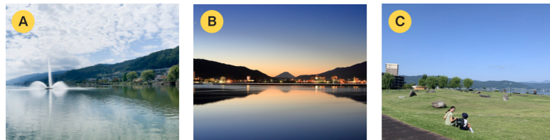
A 釜口水門と湖上噴水(岡谷市) B 諏訪湖から望む富士山(下諏訪町) C 石彫公園(諏訪市)

2市1町の湖畔からは、様々な諏訪湖の景色を望むことができます。ぜひ、諏訪湖1周に挑戦して、各地の景色を楽しみましょう。