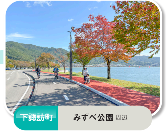
下諏訪町 みずべ公園 周辺