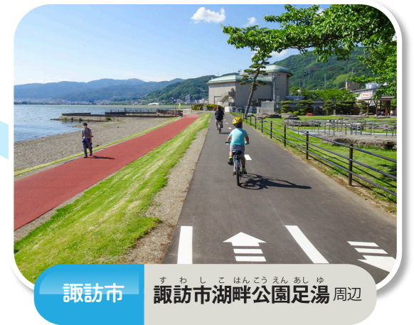
諏訪市 すわしほんでんえんあしゆ 諏訪市湖畔公園足湯 周辺