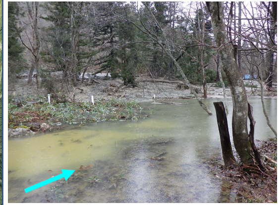
③堆積工設置 (検討中)