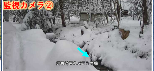
監視状況 (12/18設置完了)

■堆積工の役割 次期出水で流出する恐れのある土砂等を捕捉 (コンクリートブロック等の活用を検討)