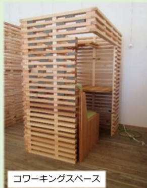
コワーキングスペース

木の体験複合施設は、コワーキングスペースや木のあそび場として提供(3/25 OPEN)