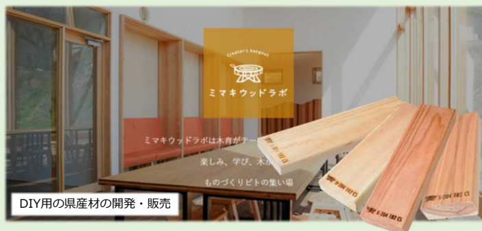
DIY用の県産材の開発・販売

木の体験複合施設は、コワーキングスペースや木のあそび場として提供(3/25 OPEN)