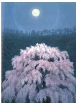
＜花明り＞ 1968年 大和証券グループ本社所蔵