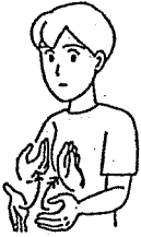
〈暖かい〉 両手で下からあおぐようにする。