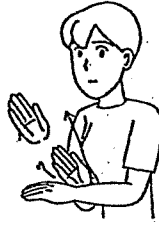
〈ありがとう〉 右手を左手甲に軽く当て、拜むようにする。