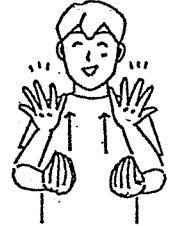
〈祝う〉 すぼめた両手を上に向けてぱつと開く。