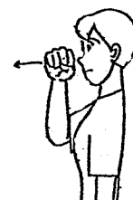
〈良い〉 右こぶしを鼻から前に出す。