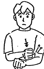
〈言勞〉 左腕を右こぶしで軽くたたく。