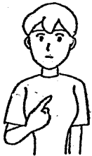
〈私①〉 人差し指で胸を指さす。