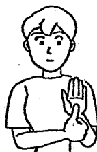
〈名前①〉 左手のひらに右親指を当てる。