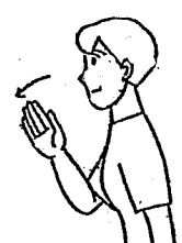
〈頷む①〉 頭を下げて右手で拜むようにする。