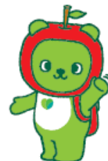
長野県 PR キャラクター 「アルクマ」