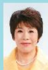
諏訪市長 金子 ゆかり