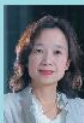
長野県副知事 中島 恵理