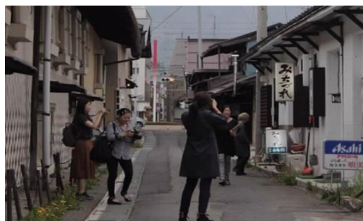
台湾のメディア関係者による取材