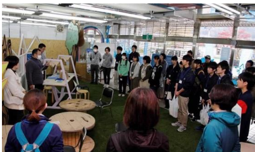
ボランティアサポーター朝の会