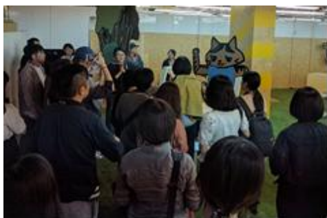
メディア関係者を対象にしたプレストツアー