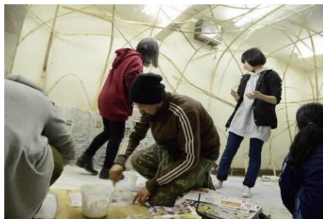
ボランティアサポーターによる作品づくり