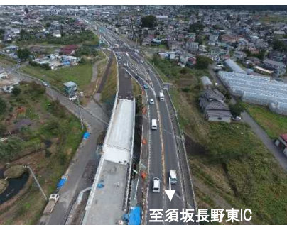
③(国)403号 須坂市 幸高～井上拡幅

4車線化整備により、市街地の渋滞緩和、安全の確保と長野須坂東ICへのアクセス向上を図ります。