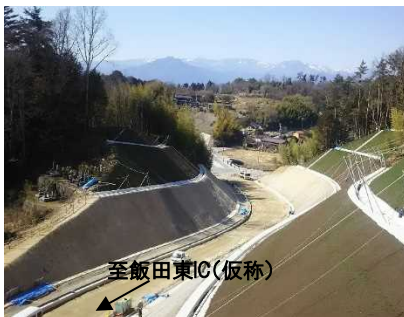
④(国)256号 飯田市 上久堅拡幅

バイパス及び現道拡幅により、狭隘区間を解消し、安全の確保と飯田東IC(仮称)へのアクセス向上を図ります。