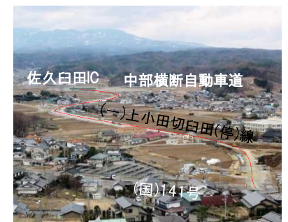
⑤(一)上小田切臼田(停)線 佐久市 下小田切

バイパスの整備により、狭隘区間を解消し、安全の確保と佐久臼田ICへのアクセス向上を図ります。