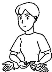
〈生まれる〉 指先を向かい合わせた両手を腹から前に出す。