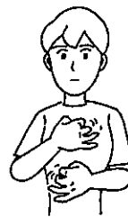
〈いつ〉 両手を上下にして、両手同時に順番に指を折る。