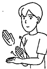
〈ありがとう〉 右手を左手甲に軽く当て、拝むようにする。