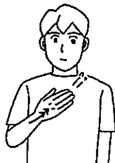
〈知る③〉 右手のひらで胸を軽くたたく。