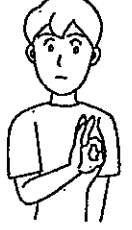
〈名前②〉 右手の親指と人差し指で作った丸を左胸に当てる。