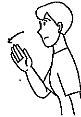
〈頼む①〉 頭を下げて右手で拜むようにする。