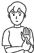
〈名前①〉 左手のひらに右親指を当てる。