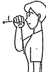
〈良い〉 右こぶしを鼻から前に出す。