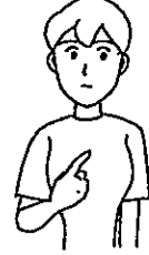
〈私①〉 人差し指で胸を指さす。