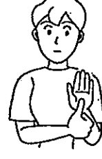
〈名前①〉 左手のひらに右親指を当てる。