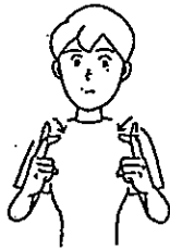
〈あいさつ〉 両手人差し指を左右から近づけて曲げ同時に表現者も会釈する。