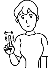
〈何〉 右人差し指を左右に振る。