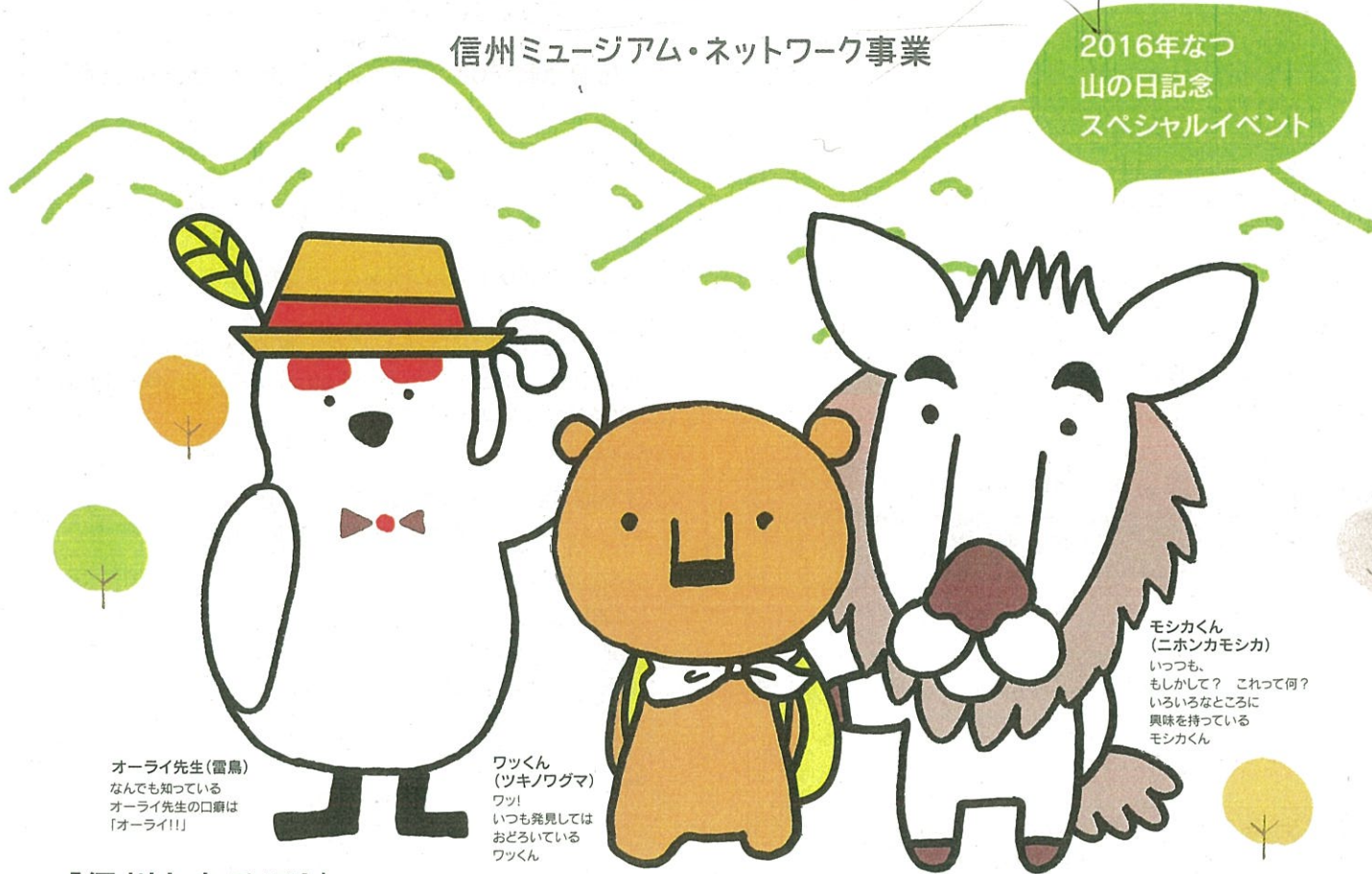
オーライ先生(雷鳥) なんでも知っている オーライ先生の口癖は「オーライ!!!」