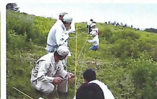
高山植物をシカから守る電気柵の設置