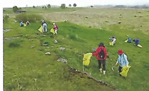
外来植物の抜き取り作業

霧ヶ峰はその自然や歴史・文化の両面で高い価値を有していますが、 近年は外来植物の繁茂やシカによる高山植物の被害など、 様々な課題に直面しています。 この美しい自然環境とそれらを彩る豊かな生き物が生息できる環境を 後世に残すため、地域では様々な環境保全活動に取り組んでいます。