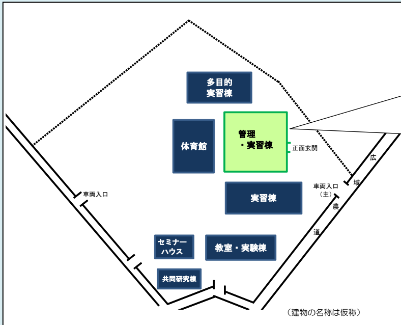
(管理・実習棟イメージ)