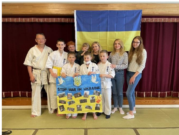
＜長野県高森町に避難したウクライナの方々＞

ウクライナ侵攻による避難民の受入れは、一国では解決できない問題となっています。この問題を解決するためには、世界は繋がっていることを意識し、グローバル社会に生きる私たちが平和な社会を実現することが何より大切なことであると信じています。長野県は、このような状況に置かれた方々を温かく支援したいという賛同者のお気持ちを受け止め、少しでも笑顔になれるようサポートを行ってまいります。