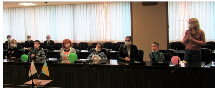
県庁にいらっしゃったウクライナ避難民の皆さん