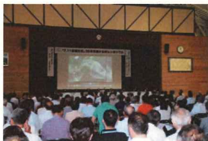
「7.11 豪雨災害を振り返る」映像放映