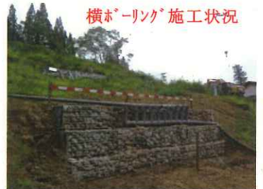
横ボーリング施工状況

地盤が軟弱で現場は難航しておりますが、降雪前に竣工を目指し、鋭意努力しております。