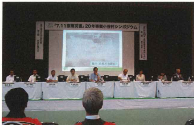
パネルディスカッションの状況

主催した小谷村長は、災害の教訓を次世代に語り継ぐことや、家族、近所、学校、地域のつながりの大切さを村民と確認し、大切な村を今後も残していきたいと述べました。