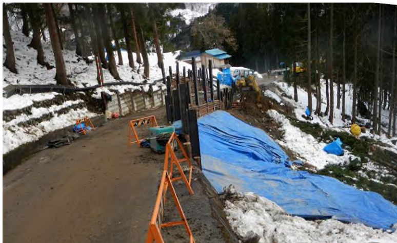
被災後の村道の状況（小谷村の応急対策道路工事）

今後融雪期を迎えて、地すべりの監視を強化するとともに、小谷村役場と連携して、早期の復旧に向けて抜本的な対策工法の検討を進めてまいります。