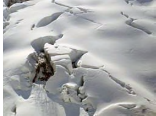
雪崩の兆候(雪の割れ目)