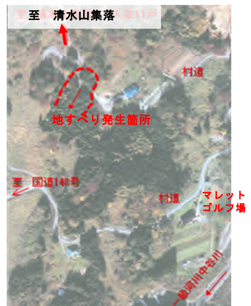
清水山集落と地すべりの位置