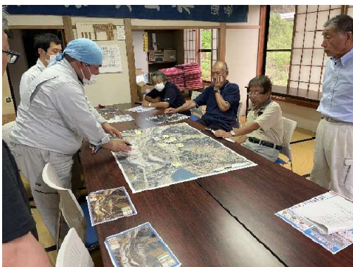
白馬村通地区懇談会（R7.7.23）