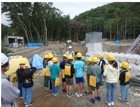
黒豆沢 堆積工（白馬村北城） （R7.10.9 白馬南小学校）