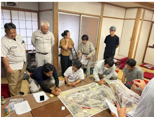
小谷村五区地区懇談会（R7.6.24）