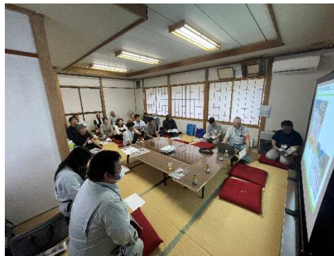
赤牛先生防災講座 （R7.6.24 小谷村五区地区）