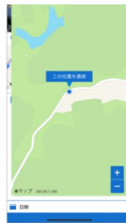
地図の位置を合わせ、「こ この位置を通報」をタップ