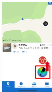
右下のトングマークを上 にスライドさせる