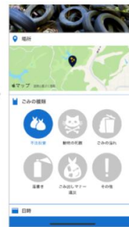
必要情報を登録後、「通報」 をタップして送信完了!