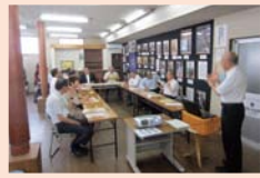
元気づくり支援金事業の視察

7月25日～26日に警察学校など6現地機関と元気づくり支援金事業箇所4箇所を、また、9月6日に東京事務所を調査しました。