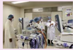
長野市民病院(長野市)の視察

8月29日～30日に長野保健福祉事務所など5現地機関と長野市民病院など5箇所を調査しました。