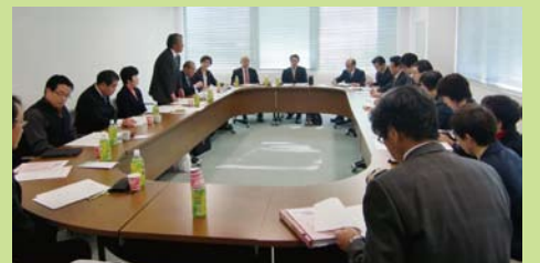
関係団体との意見交換の様子