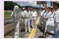
北陸新幹線飯山駅関連事業の調査

8月26日～28日に北信建設事務所など13現地機関と道路事業など10箇所を調査しました。