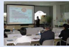
東洋計器株式会社(松本市)の視察

8月1日～2日に長野地方事務所など12現地機関と東洋計器株式会社など4箇所を調査しました。