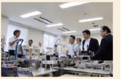
工科短期大学の調査