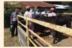
下伊那農業高等学校の調査

8月27日～28日に総合教育センターなど4現地機関と飯田OIDE長姫高等学校など3教育機関を調査しました。