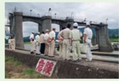
県営かいかい排水事業の視察

9月4日～5日に長野地方事務所など9現地機関とかがい排水事業など11箇所を調査しました。