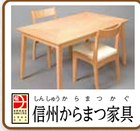
信州からまつ家具