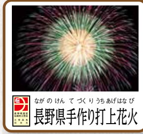
長野県手作り打上花火