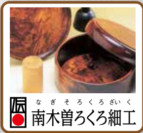
南木曽ろくろ細工