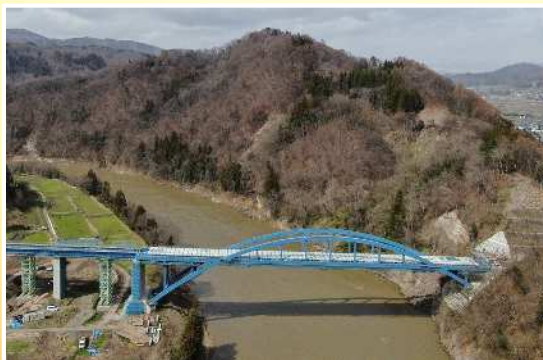
笠倉壁田橋（中野市）