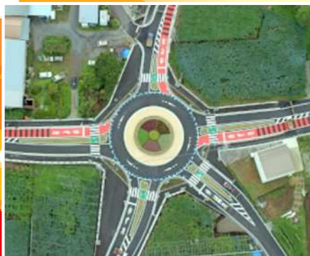
ラウンドアバウト（須坂市）