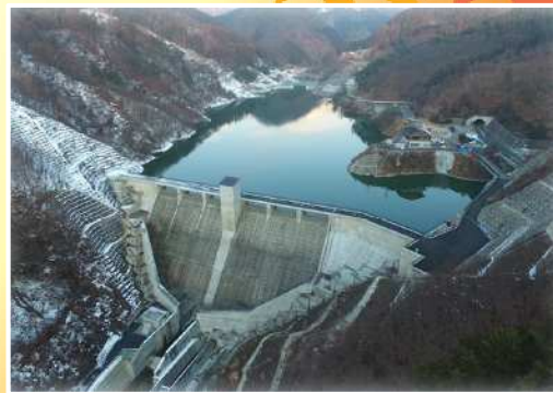
浅川ダム：試験湛水満水時（長野市）