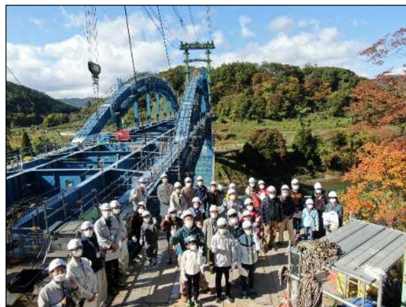
昨年度の見学会の様子：笠倉壁田橋（中野市）