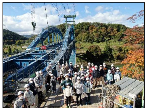
昨年度の見学会の様子：笠倉壁田橋（中野市）