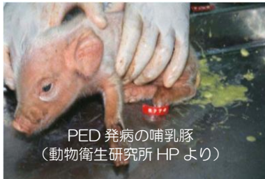
PED 発病の哺乳豚 (動物衛生研究所 HP より)