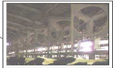
換気扇による送風(福井県)