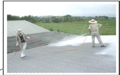
石灰の吹きつけ(宮崎県)