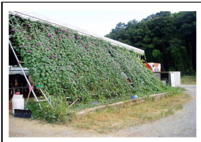
ネットに植物を這わせる(兵庫県)