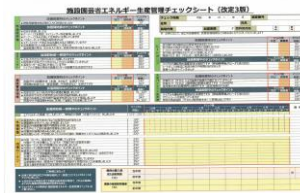
▲省エネチェックシート