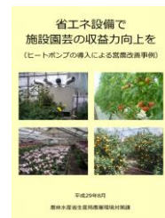
▲省エネで収益力向上を