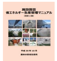
▲省エネマニュアル