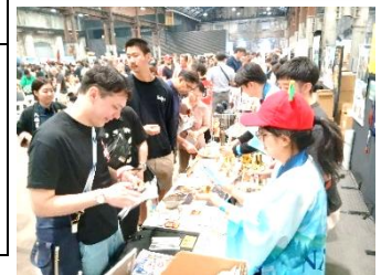
昨年の酒フェスティバルの様子