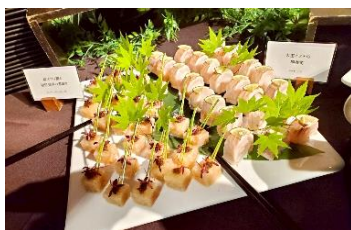
昨年の米国バイヤー招へいの様子