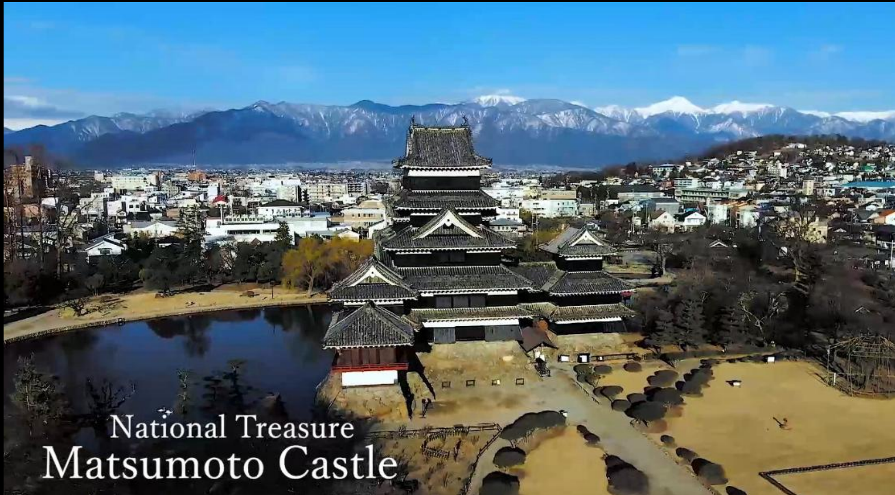
National Treasure Matsumoto Castle