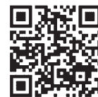
認証キーの取得方法 発注者への提出方法