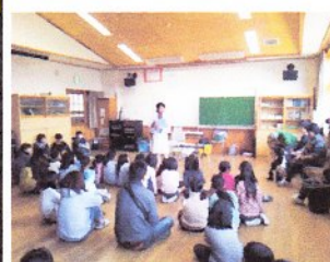
動物ふれあい教室(出前教室)