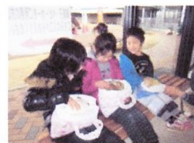
動物とのふれあい