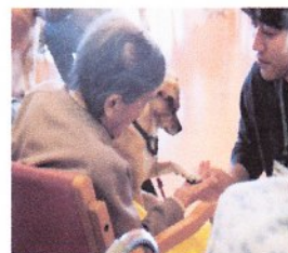
動物ふれあい訪問