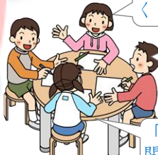
同僚と共に授業を振り返って

「Aさんは仲間や先生と共に活動することのよさを感じていたよ。やりたい活動が広がっていく中で仲間や先生に困ったことやうれしいことを伝えられるといいね」