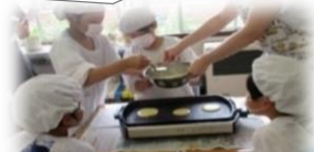
仲間と共に活動するAさん

お楽しみ会に向けてのパンケーキ作りの中で、順番を守りながら楽しそうに活動するAさんの姿が見られてうれしかった！