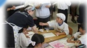
仲間のよさをどう伝えるかを先生に聞くAさん

「Cちゃんと一緒に作れてよかったよ。Cちゃん、お手伝いをまたお願い！」 「先生、Cちゃんの作ったパフェがきれいだというをどうやって書いたらいいかな？」