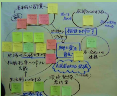
みんなでよりよい方向を議論した跡

教頭役のPTA会長さんは、模擬運営委員会終了後の感想発表で「PTA会長になり、学校へ出かける機会が増して、先生たちがとても忙しいことが分かった。そのことについて話せてよかった」と語っていました。