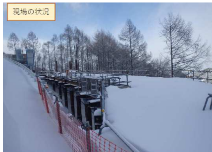
令和5年1月 積雪60cm この後、75cmまで積もります！