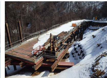
令和5年3月 積雪50cm 温かくなってきて、解け始めています！