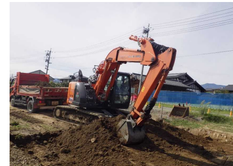
路床掘削状況(道路を所定の高さにするための掘削作業)