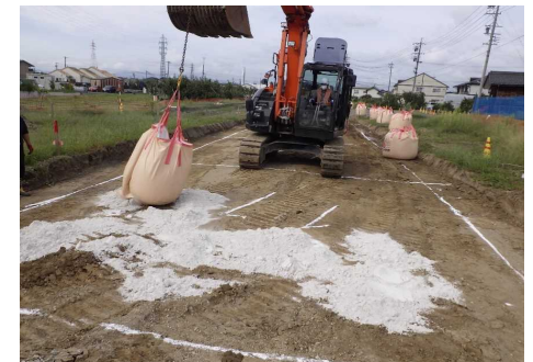
路床改良(石灰系)状況(軟弱な地盤を固めています)