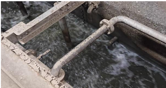
写真1：汚水に空気を送る反応槽(11/29～)

5つの池（反応槽）で微生物によって汚れを分解する「生物処理」を行っていましたが、被災し使用できなくなりました。微生物に酸素を供給する仮設の装置を設置し、2つの池で簡易生物処理を行えるようになり（写真1）、残り3つの池についても引き続き復旧作業を進めています。