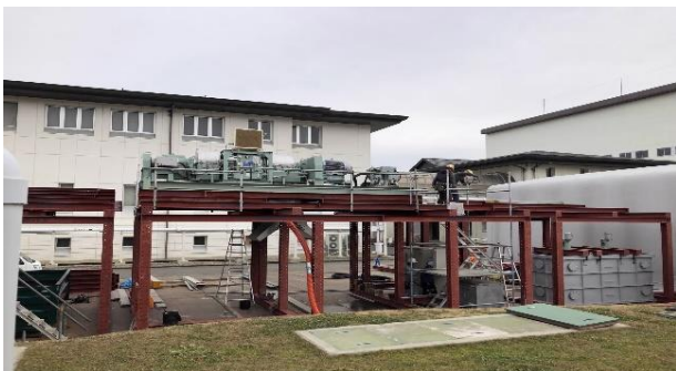
写真2：仮設汚泥脱水機(2/19～)

下水を処理する過程で生じる汚泥から、水分を分離する汚泥脱水機が被災したため、仮設の設備で脱水しています（写真2）。