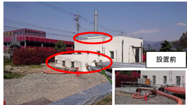
写真3：下水流入開口部の覆い設置(4/30～)

仮設ポンプを設置するために開放されていた下水流入部を、臭気対策のため覆いました（写真3）。