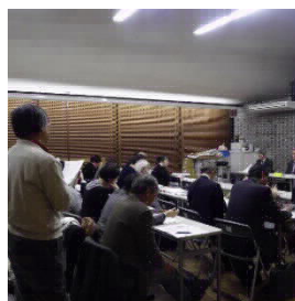
●ミニ・フォーラム (2017. 2. 24長野/3. 14飯田 /4. 13松本/4. 26小諸)