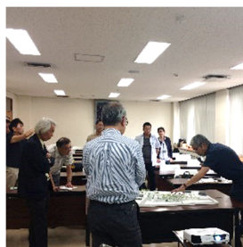
□県民リレーWS No. 5 (南信地域) (2017. 9. 18 男女共同参画センター)