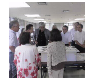
▼長野県文化芸術議員懇談会 北信美術会との懇談会 (2017. 8. 25 県庁)