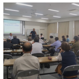
△県民リレーWS No. 6 (中信地域) (2017. 9. 18 安曇野市豊科公民館)