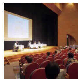
■キックオフ・フォーラム (2017. 7. 15長野市 若里市民文化ホール)