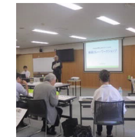
☆県民リレーWS No. 3 —美術関係者 (2017. 9. 05 長野県庁)