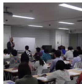
▲ミニ・フォーラム in 信州大学 (2017. 5. 29 信州大学松本キャンパス)