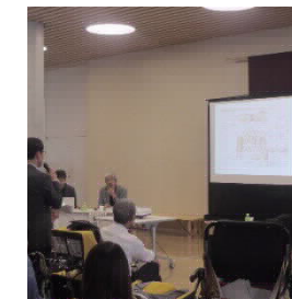
◎県民リレーWS No. 1&2 (2017. 9. 02 長野市役所)