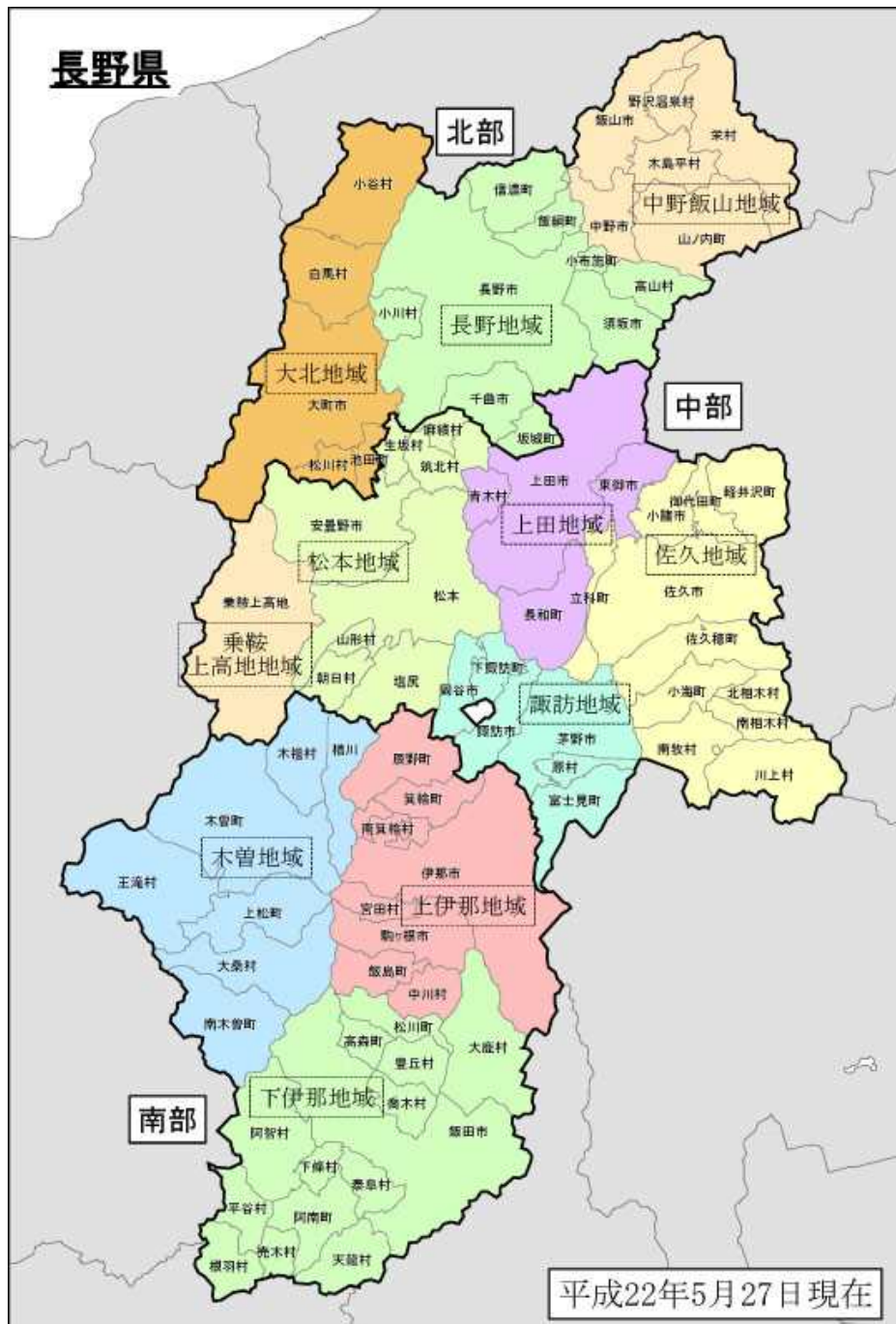
図は、太実線で囲まれた区域が一次細分区域を表し、囲み文字でその名称を記述している。灰色の実線で囲まれた区域が二次細分区域を表し、影付き文字でその名称を記述している。色分けされた区域が市町村をまとめた地域を表し、点線囲み文字でその名所を記述している。 ※市町村をまとめた地域とは、二次細分区域ごとに発表する警報・注意報の状況を地域的に概観するために、災害特性や県の防災関係機関等の管轄範囲などを考慮してまとめた地域である。

長野地方気象台では、天気予報を県内を気象特性、災害特性及び地理的特性により3つに分けた一次細分区域（北部、中部、南部）単位で発表している。また、警報や注意報は二次細分区域（市町村、ただし松本市と塩尻市は分割）単位で発表している。