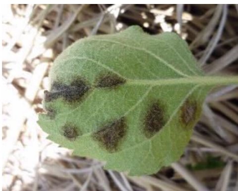
写真3 黒星病の葉裏での病斑（リンゴ黒星病） 黒くすすけた菌そうがみられる