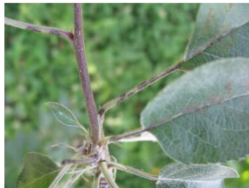
写真4 葉柄での病斑（リンゴ黒星病）