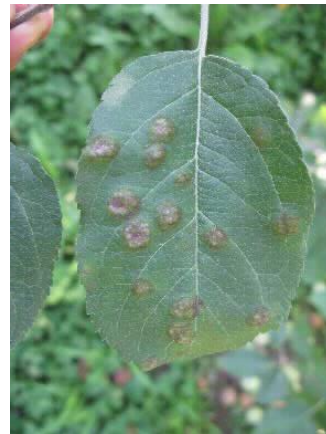
写真2 黒星病の葉での病斑（リンゴ黒星病） 次第に病斑部が隆起する