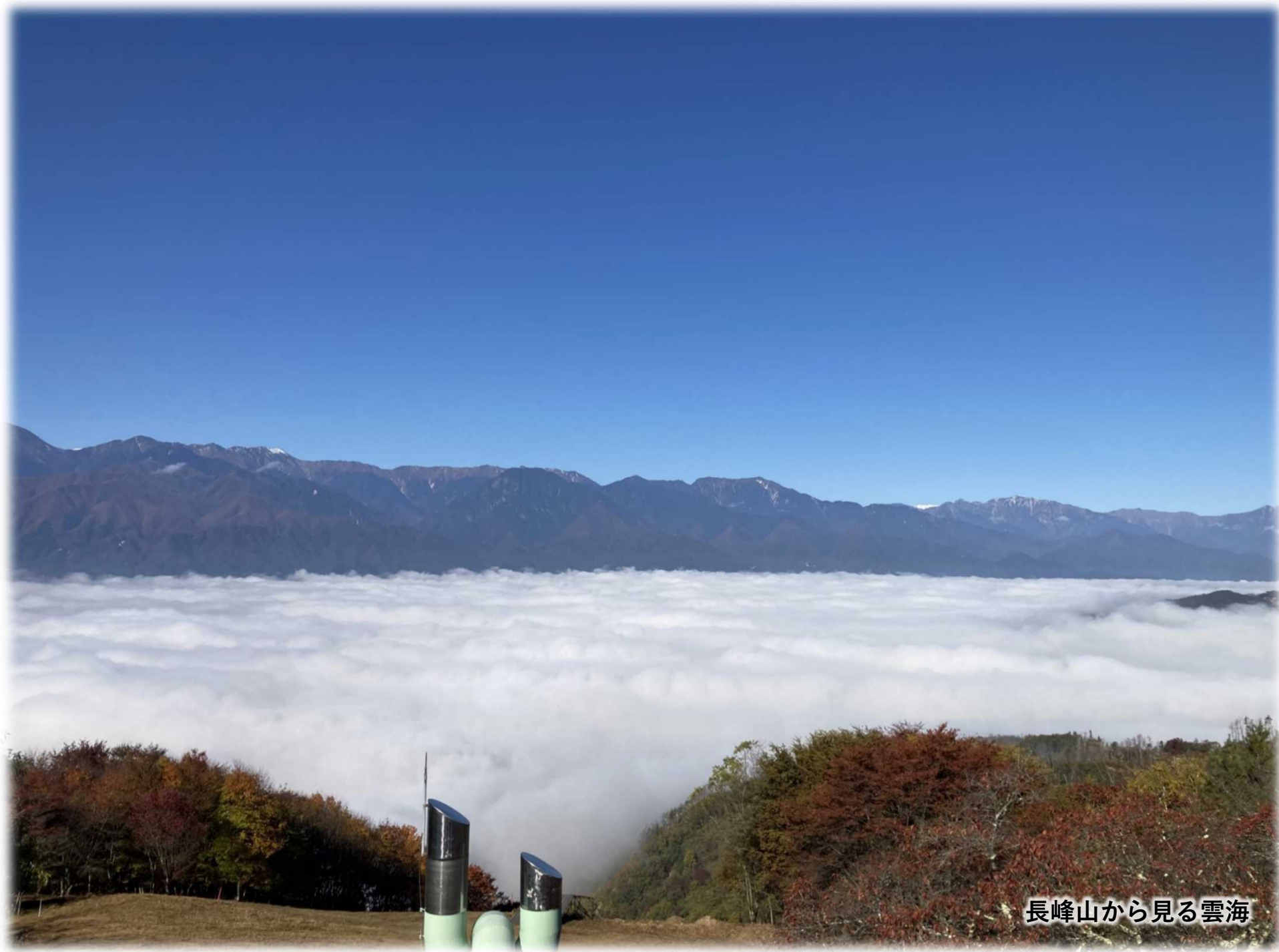
長峰山から見る雲海