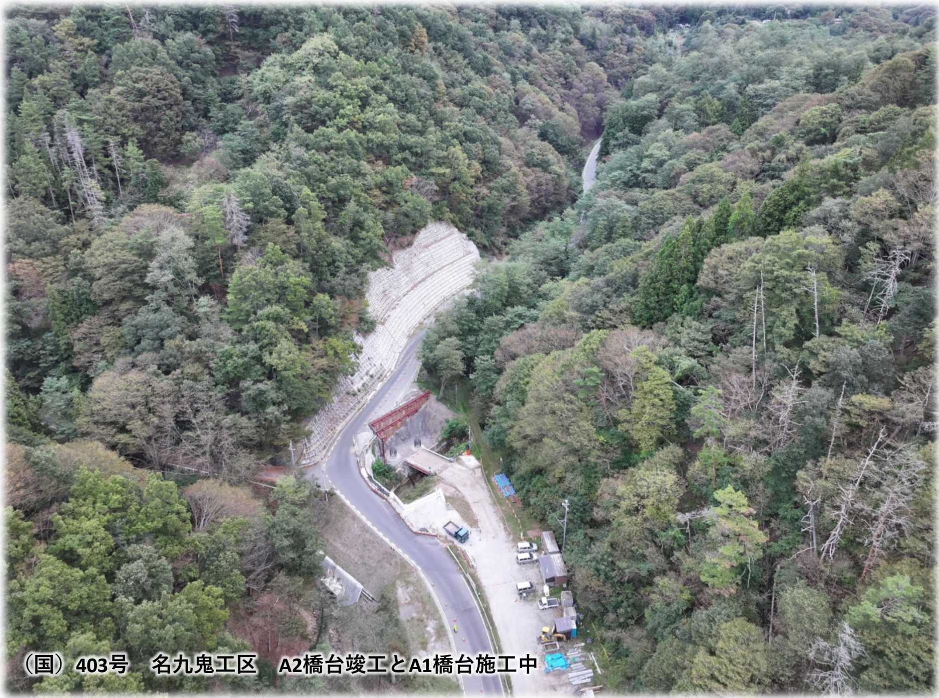
(国) 403号 名九鬼工区 A2橋台竣工とA1橋台施工中