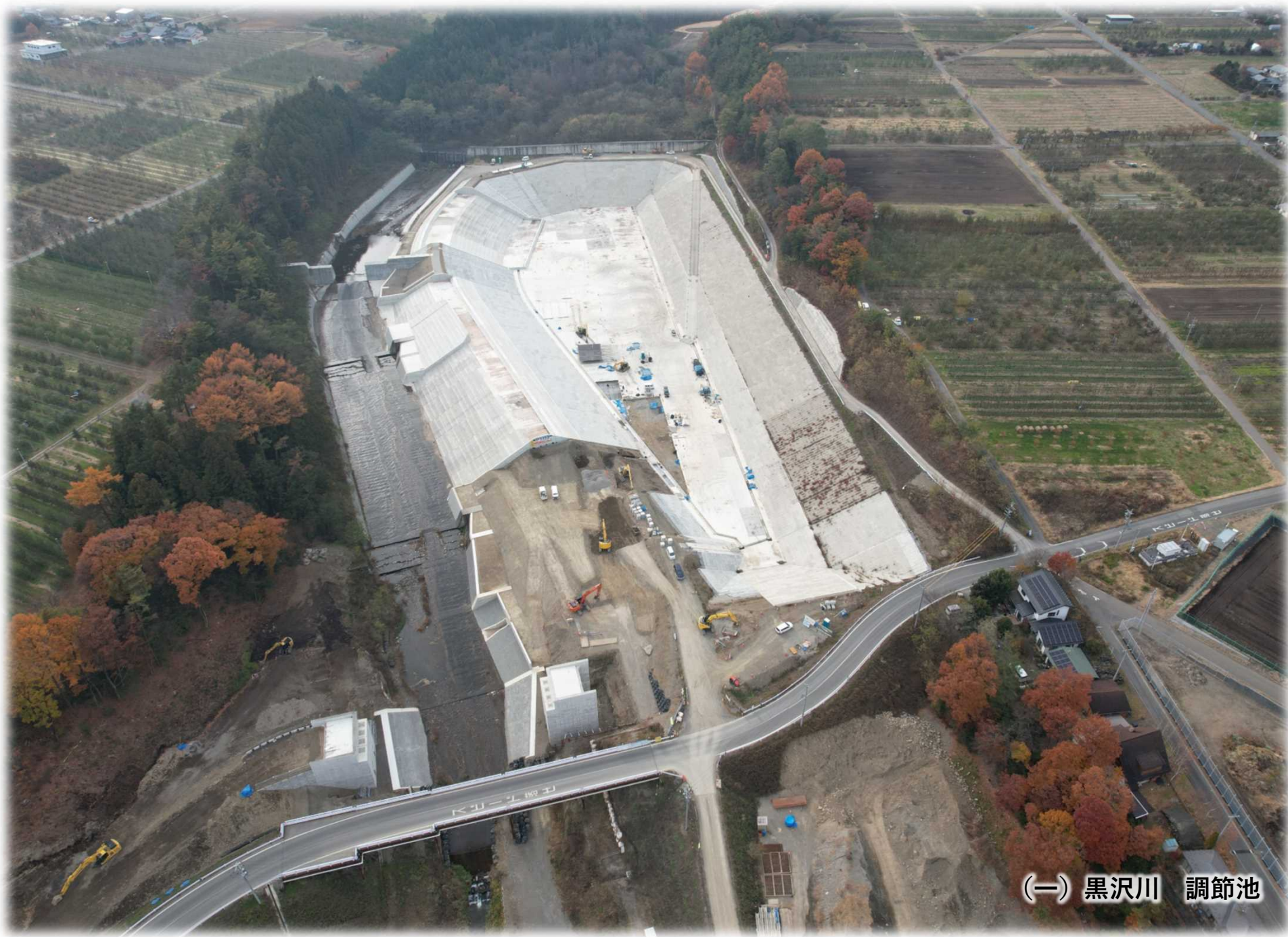
(一) 黒沢川 調節池