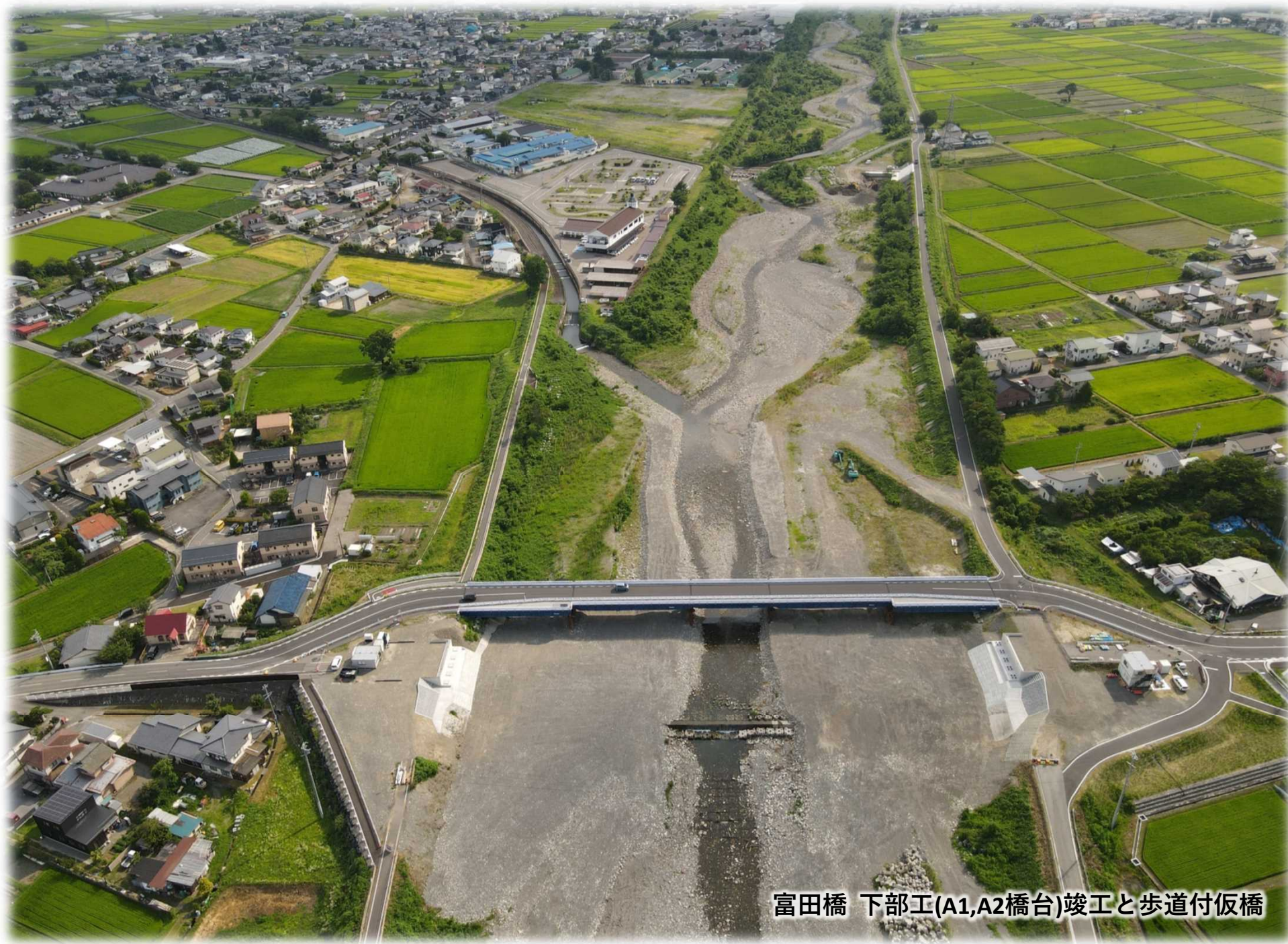
富田橋 下部工(A1,A2橋台)竣工と歩道付仮橋