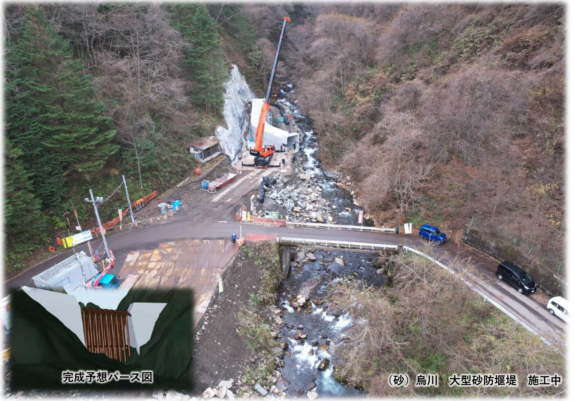
完成予想パース図