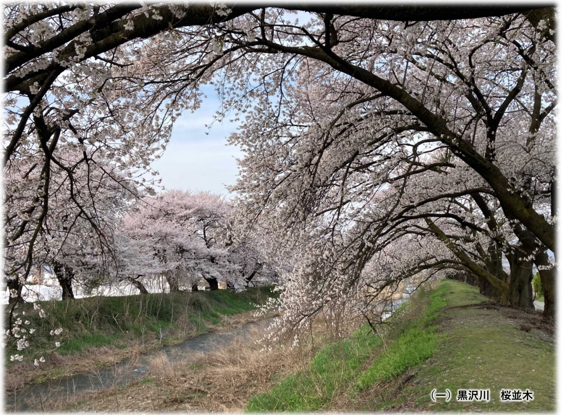
(一) 黒沢川 桜並木