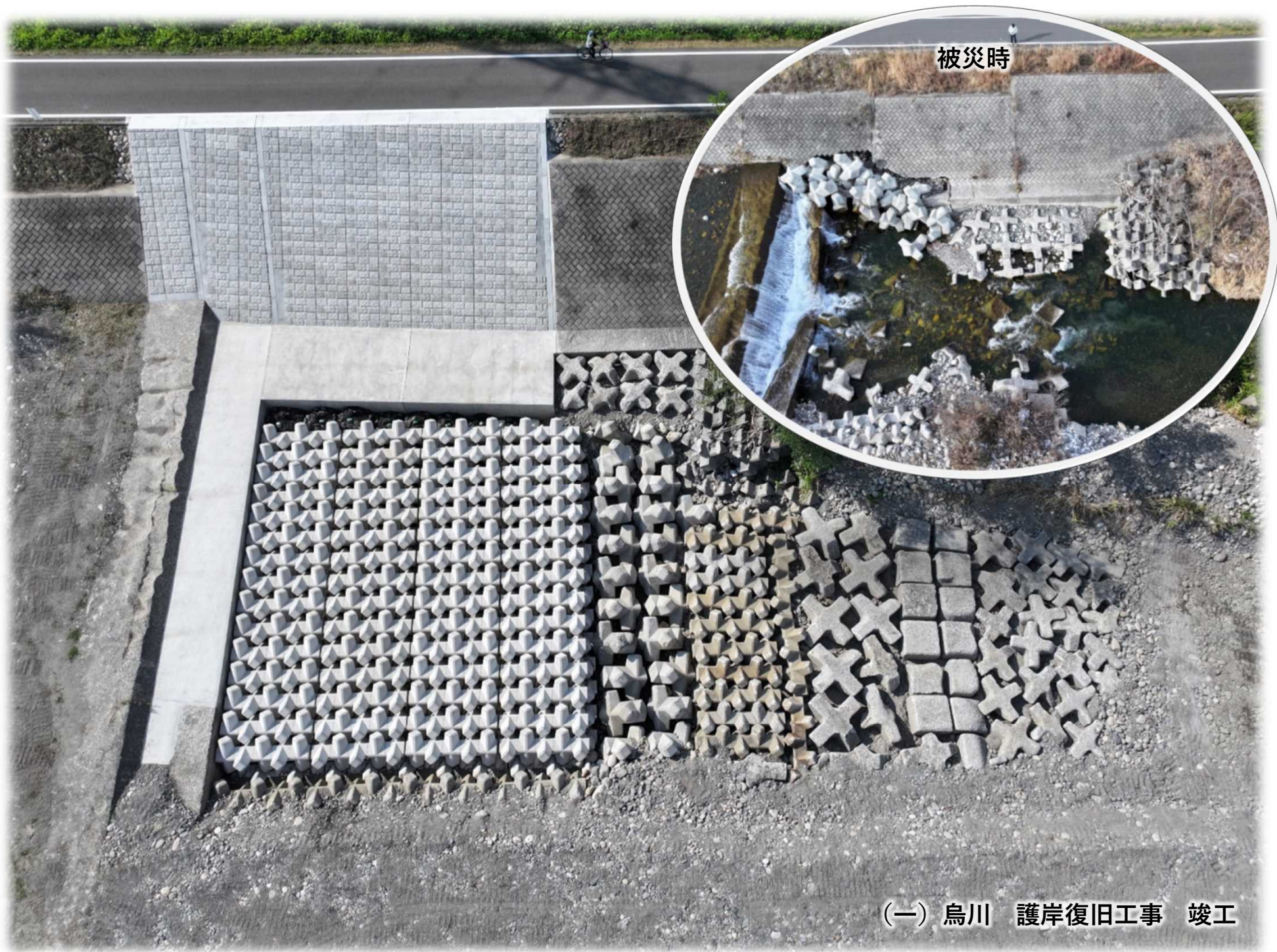
(一) 烏川 護岸復旧工事 竣工