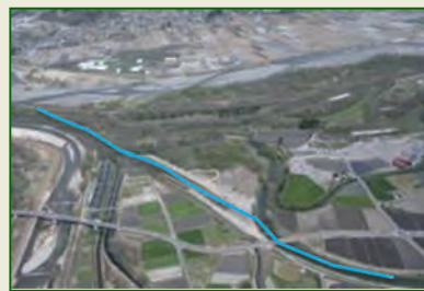
平成21年 万水川河川改修が36年余の期間を経て、完成