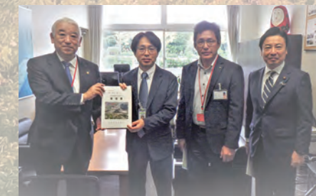
令和7年10月31日 国への要望 安曇野市 道路事業(安曇野道路)