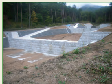
平成25年 (砂)富士尾沢川 堆積工 完成