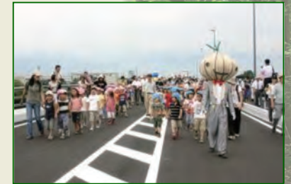
平成19年 アルプス大橋開通 高家バイパス全線供用

主な出来事 平成17年 安曇野市誕生 19年 安曇野市と松本市を結ぶアルプス大橋が開通 22年 長野自動車道 梓川スマートIC開通 23年 安曇野市などが舞台のNHK連続テレビ小説「おひさま」放送開始 24年 長野自動車道 豊科ICが安曇野ICに改名 27年 安曇野市役所本庁舎完成 第1回信州安曇野ハーフマラソン開催