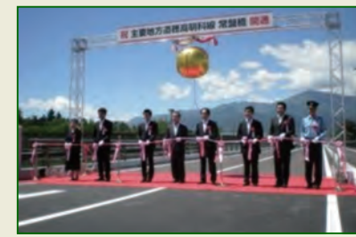
平成27年 (主)穂高明科線 常盤橋 開通