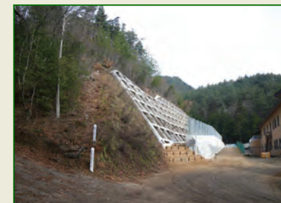
平成27年 (急)有明苑 対策工 完成