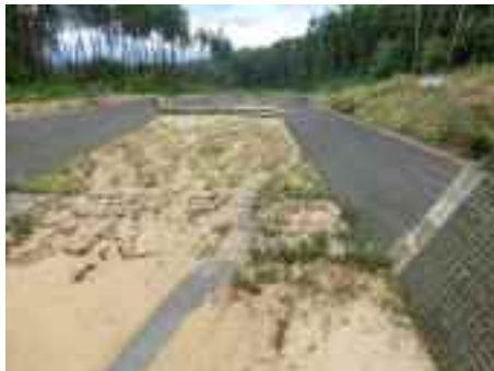
堆積工の設置（平成25年度）