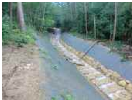
治山事業の実施（林務部）