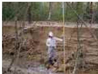
下流では被害発生