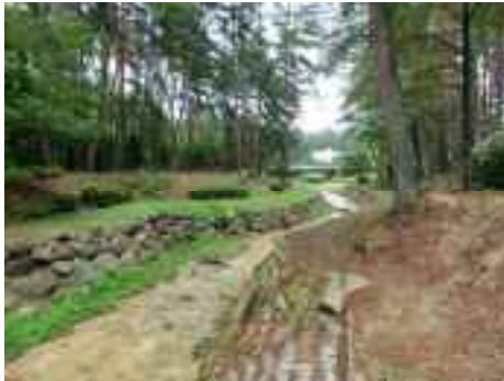
砂防流路工の整備（平成2年度）