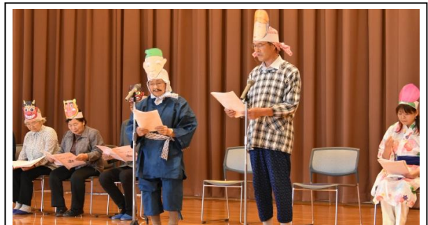
男女共同参画朗読劇