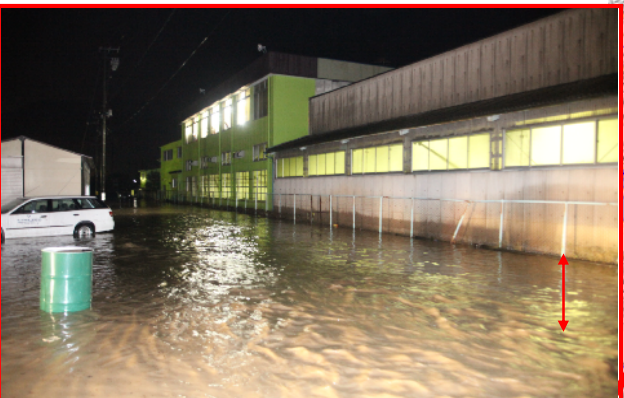
諏訪部地区浸水被害状況 上：サンタ軽金属の南側 下：県道の東側地域が浸水し、 その水が県道下を通過して、県道西側へ流下している。