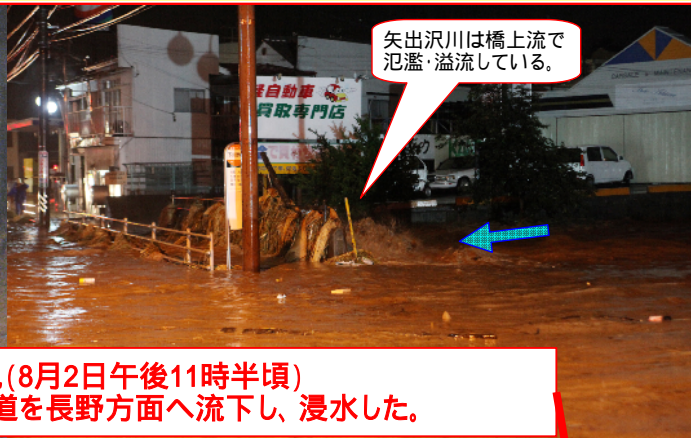
矢出沢川は橋上流で 氾濫・溢流している。