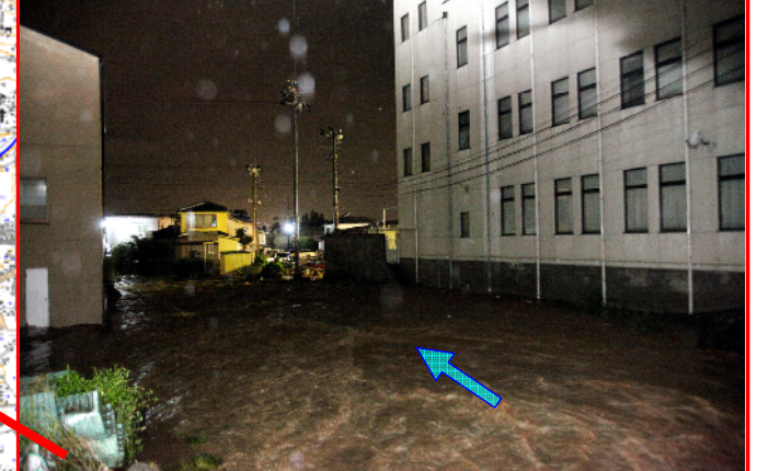
川原柳橋下流の出水・溢流状況 (右の建物は上田信用金庫 8月2日午後11時半頃)