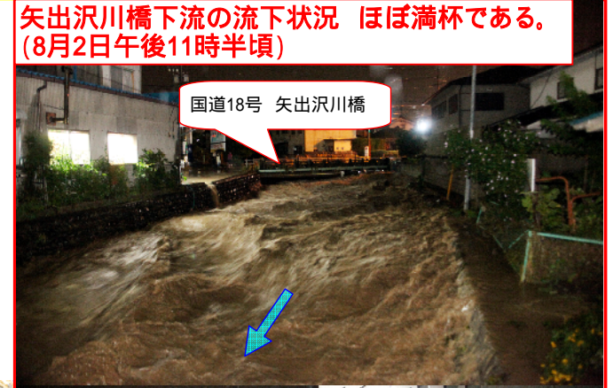
矢出沢川橋下流の流下状況 ほぼ満杯である。 (8月2日午後11時半頃)