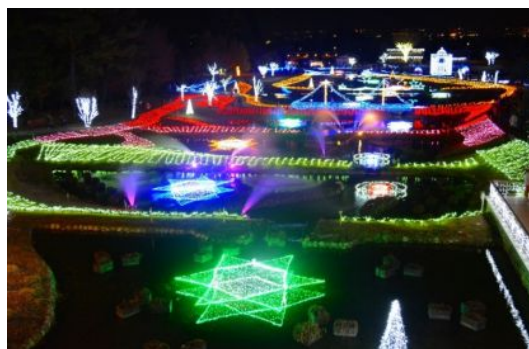
写真は昨年の様子です。