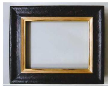
黒漆塗りの和風額縁

本事業では、木曽木材を使った木曽材木工芸品、木曽漆器等と新技術である3Dモデリングシステムを融合し、新デザイン・高品質で価格競争力のある額縁「新和風額縁」を開発する。