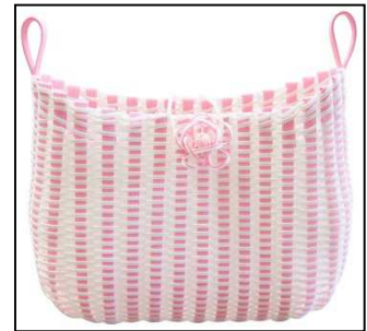
【水引と紙バンドのコラボバッグ試作品】

このような中で、地元出身のメイクアップアーティストからのニーズにより水引の美しさを活かしたバッグの製造について着手することになり、本事業により諸課題を解決をしながら水引自体の色合いや手触り感、ハンドメイド等の特長を残し、新たな商品開発(バッグ)や既存商品の性能向上による新たな販路を開拓していく。