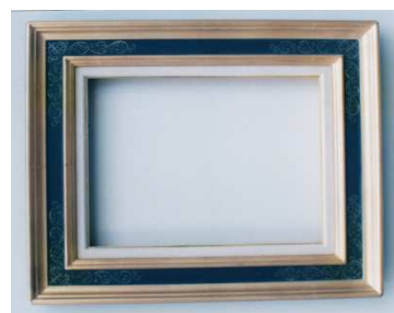
沈金を施した和風額縁

主要顧客として想定している絵画のプロ・専門家を主顧客として狙う。また、本物志向のアート・絵画に興味があるシルバー世代もターゲットとする。