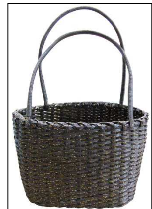
【水引100%バッグ試作品】

はじめは、本事業のきっかけとなったメイクアップアーティストを通じた芸能関係者への販売を通じて販路を開拓していく。その後、展示会等へ積極的に出展し国内外の一般富裕層へ向けて販売を行う。