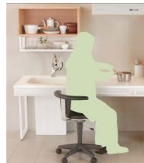
<たいらなベース・ワークスタイル>