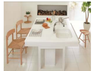
<たいらなベース・コミュニケーションスタイル>