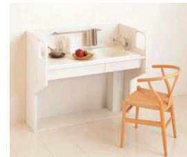
<らくすわミニ デスクスタイル>