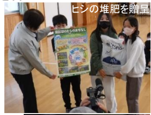
ヒシの堆肥を贈呈

諏訪湖のヒシを刈り取って堆肥化し、地元小中学校等で利用する事業を令和3年度から実施しており、本年度も諏訪管内47の小中学校、養護学校に堆肥を配布しました。令和5年11月21日には、小中学校を代表して、諏訪市立豊田小学校、諏訪市立上諏訪中学校でヒシ堆肥の贈呈式を行いました。児童、生徒の皆様には、学校の畑、花壇等で堆肥を利用する体験を通して、諏訪地域の環境保全や資源の地域循環について学んでいただきたいと思います。また、贈呈式の後には、ヒシの特性や堆肥化によるメリット、諏訪湖に生息する希少なトンボ「メガネサナエ」などについて解説しました。ヒシの実やメガネサナエの羽化殻の実物にも触れていただき、関心を持っていただけたのではないかと思います。