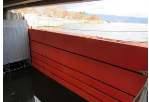
諏訪湖の水をせき止める仮設ゲート

現在工事中の部分では、諏訪湖の水を堰き止めて作業をしており、普段は諏訪湖の水で覆われ見えないところ(ゲート敷き部分)を見学することができました。