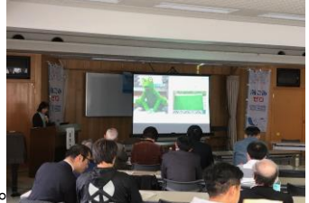
栗岡先生による講演

視認しにくい細かなごみの対策として具体的な取組を行っている方はまだ多くはないと思いますが、どんな影響があるのか、どうすればよいのか等を業界団体の皆様も含めそれぞれの立場で考えるきっかけになったと思います。