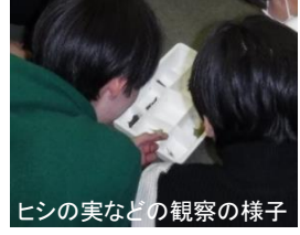
ヒシの実などの観察の様子

ヒシの刈り取りや利活用、メガネサナエの保全に向けた取組は、令和6年度も実施する予定です。引き続き皆様にご協力いただくとともに、諏訪湖の環境改善に向けた地域での活動にもぜひご参加いただければと思います。