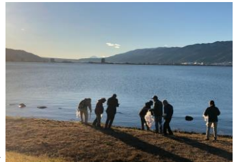
諏訪湖と富士山を背景にゴミ調査

諏訪湖のごみは随分と少なくなってきましたが、ごみがなくなったわけではありません。細かくなったごみに気が付いていないだけなのです。今回のサミットや諏訪湖まるまるゴミ調査等を通じて、このことに気が付き、取り組みにつなげていただくと、より良い水辺の環境をつくる第一歩になると思っています。今後も、皆さんと力を合わせ、諏訪湖から川のごみ、海のごみをなくすための活動を続けていきたいと思っています。