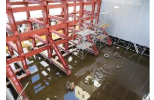
普段は諏訪湖の水で覆われている箇所