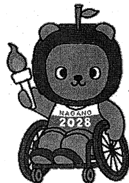
第82回国民スポーツ大会・ 第27回全国障害者スポーツ大会 マスケットキャラクター 「長野県PRキャラクター アルクマ」 ©長野県アルクマ